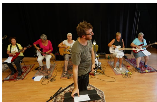
© - Patrice Nin - Ville de Toulouse ( prise de vue de l'atelier à l'espace Saint cyprien )