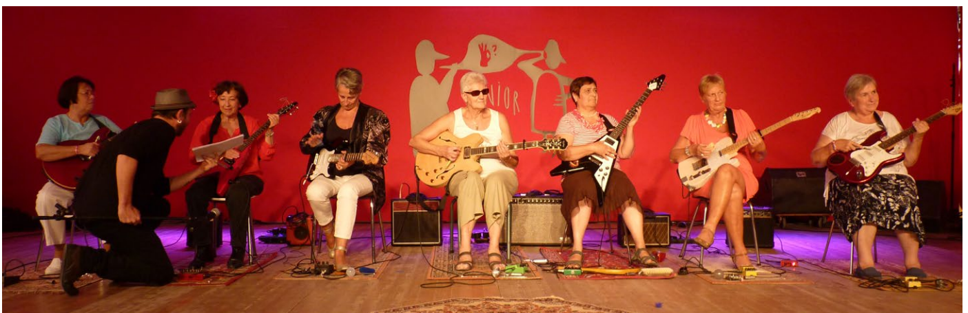
représentation place du Capitole à Toulouse en 2014 - semaine «Seniors et plus».