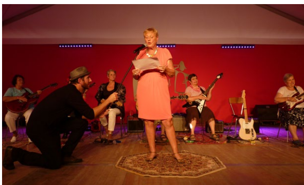
© Freddy Morezon - représentation place du Capitole à Toulouse en 2014 - semaine «Seniors et plus».