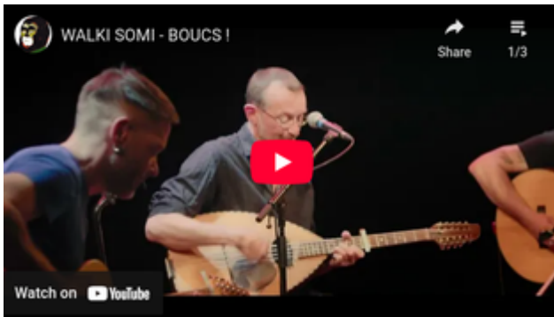
Concert de création La Cité de la musique de Marseille Mars 2024