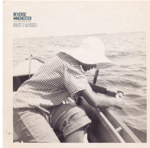
Route 2 Ulysses 2022

Né de leur rencontre lors des échanges franco-américains The Bridge, Reverse Winchester développe une musique brute et organique où chanson, scansion et improvisation dialoguent sans frontières.